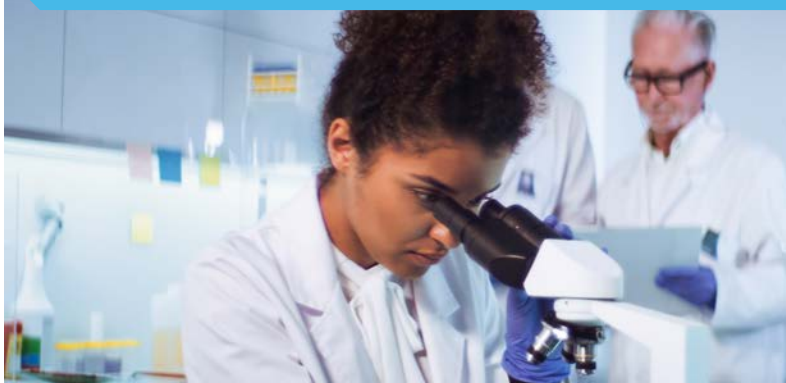
PROGRAMA DE ENSAYOS FASE 1

Hable con su médico para analizar si un ensayo clínico podría ser adecuado para usted, y para conocer sus opciones.